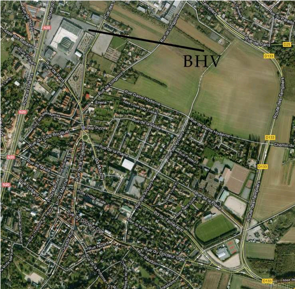
Le BHV de Montlhéry est situé 60, route Nationale 20 au nord de la ville en direction de Paris