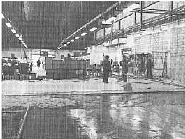
Le BHV dans les années 60

Début février 2012, le groupe Galeries Lafayette annonce la fermeture de son magasin à Montlhéry d'ici juillet 2012. Il est à craindre que les Galeries Lafayette ne vendent la propriété afin de réaliser une opération immobilière juteuse. Une fois cédée, plus rien n'empêcherait le nouveau propriétaire de procéder à la démolition de l'édifice. Pourtant, aujourd'hui encore, le bâtiment principal, malgré des aménagements successifs, conserve des particularités propres aux constructions des années 60, notamment les voûtes en béton sur le toit. Celles ci sont remarquables.