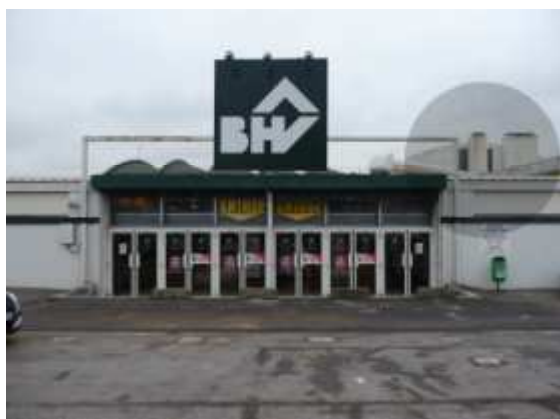
Le BHV de Montlhéry doit fermer ses portes d'ici l'été 2012